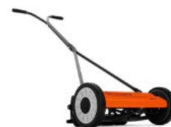
54 ノヴォレット/64 ノヴォレット

刈刃: 5 枚刃 刈幅: 400mm 刈高: 12-38mm の 4 段階調整 質量: 9.1kg 価格: 19,000 円(税抜) ソフトグリップハンドル 樹脂性ホイールギア 静音 耐久性のあるリール刃と受け刃 頑丈なホイール