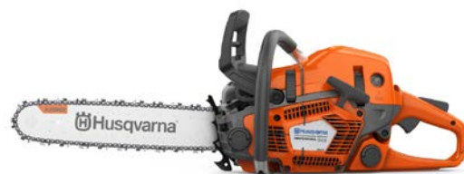
545 Mark II