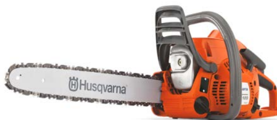
120e Mark II

使いやすく、始動も簡単。小木の伐採や薪づくりを時々行うホームオーナーに最適なガーデンチェンソー。低排ガス、低燃費の X-Torq®エンジンテクノロジーとフィルターを清潔に保つエアインジェクションの特長を備えています。安全性を高めるためのローキックバックチェン付き。ツールレスチェーンテンショナーにより、チェン張りも工具を使わず、簡単に行えます。SmartStart®で、始動性も抜群。