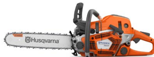
550XP® Mark II

ハスクバーナ 550XP® Mark II と 545 Mark II は、どのような環境でも、優れた加速とトルクにより、他に類のない鋸断能力を発揮します。耐久性に優れ、始動が容易で、過酷な作業条件でも長時間効率よく作業ができるための快適性、制御性、操作性のすべてが備わっています。伐倒、枝払い、玉切りとあらゆる作業に最適化されているため、手足のように使え、スキルと経験を最大限に発揮していただけます。完璧な鋸断を目指した、新型次世代のチェーンソーです。550XP®G Mark II は、ヒーティングハンドル仕様です。