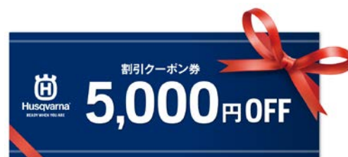
550XP®/XP®G Mark II 新発売キャンペーン

ぜひ、お得なキャンペーン期間に、550XP®/XP®G Mark II、572XP®/XP®G をお求めください。