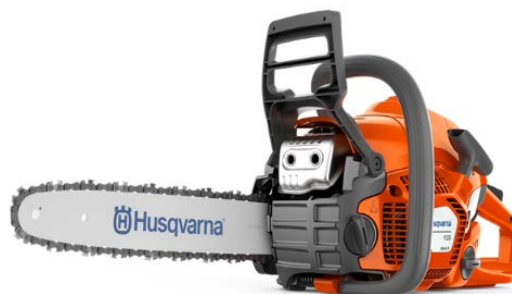
135 Mark II

堅牢なつくりで、信頼性があり、使いやすく、ホームオーナーが使うのに十分な切削性能を備えています。小木の伐採や薪づくりを不定期に行うのに最適なガーデンチェンソー。すばやく始動し、簡単に取り扱うことができます。サイドチェーンテンショナーにより、チェン張りも簡単です。SmartStart®で、始動性も抜群。