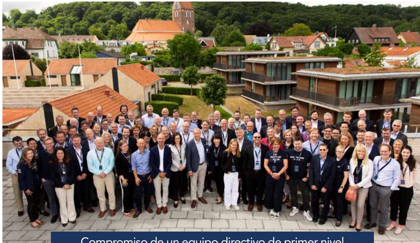
Compromiso de un equipo directivo de primer nivel